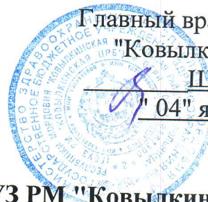
График работы мобильного пункта вакцинации ГБУЗ РМ "Ковылкинская ЦРБ" на март 2023 г