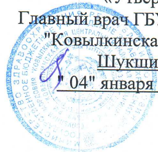
График работы мобильного пункта вакцинации ГБУЗ РМ "Ковылкинская ЦРБ" на май 2023 г