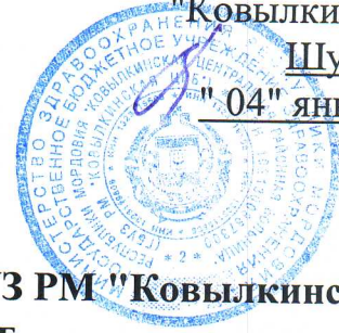
График работы мобильного пункта вакцинации ГБУЗ РМ "Ковылкинская ЦРБ" на февраль 2023 г