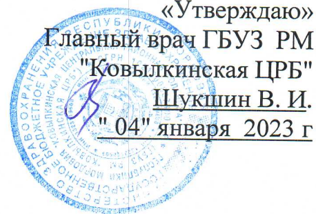
График работы мобильного пункта вакцинации ГБУЗ РМ "Ковылкинская ЦРБ" на октябрь 2023 г