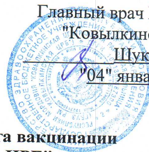
График работы мобильного пункта вакцинации ГБУЗ РМ "Ковылкинская ЦРБ" на август 2023 г