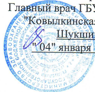
График работы мобильного пункта вакцинации ГБУЗ РМ "Ковылкинская ЦРБ" на сентябрь 2023 г