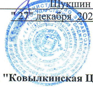
График работы мобильного пункта вакцинации ГБУЗ РМ "Ковылкинская ЦРБ" на январь 2023 г