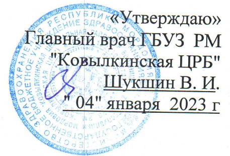
График работы мобильного пункта вакцинации ГБУЗ РМ "Ковылкинская ЦРБ" на ноябрь 2023 г