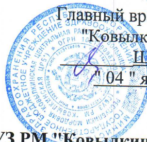
График работы мобильного пункта вакцинации ГБУЗ РМ "Ковылкинская ЦРБ" на декабрь 2023 г