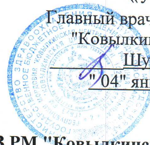
График работы мобильного пункта вакцинации ГБУЗ РМ "Ковылкинская ЦРБ" на апрель 2023 г